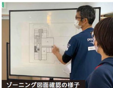
ゾーニング図面確認の様子